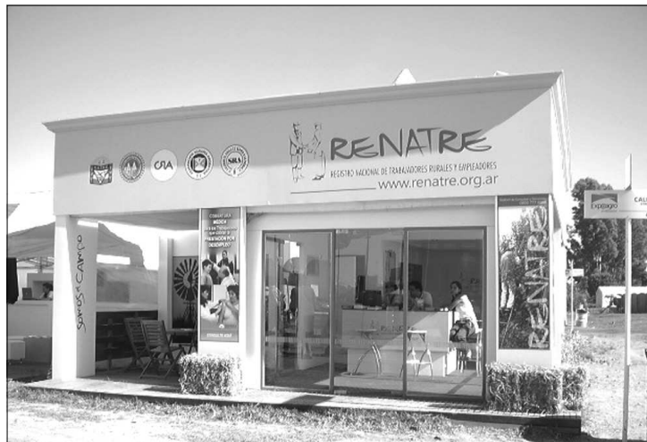
■ El RENATRE también tiene su presencia en Expoagro 2010.

Se trata de un documento personal, intransferible y probatorio de la relación laboral. ■